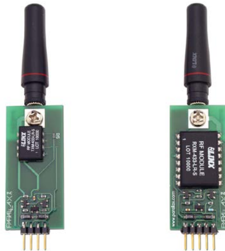
Figura 2 : transmissores e receptores disponíveis no mercado

Partindo desta idéia básica os alunos modificam o projeto tendo em vista uma aplicação específica do interesse da equipe. Assim por exemplo, os alunos decidem realizar o controle de um robô móvel. Neste caso, eles decidem substituir, no lado da recepção o PC por uma placa com microcontrolador que irá controlar os servomecanismos do robô. O tema dos projetos varia de semestre a semestre, partindo de uma aplicação prática escolhida pelos alunos, podendo envolver conhecimentos de outras disciplinas do curso. Os alunos utilizam-se de circuitos de comunicação disponíveis no mercado (TELECONTROLLI, 2007), em geral as equipes compram os componentes para o projeto, e/ou utilizam-se de recursos de outras disciplinas (placas com microcontroladores, sensores, motores, servomecanismos, atuadores